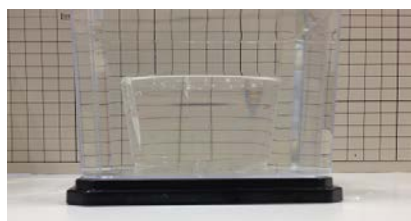
屈折率が合っていない場合：背景が歪んで見える