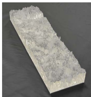
研磨パッド表面の透明模型

3D プリンタやマシニングセンタで鋳型を作り，透明シリコンゴム製の模型を作製します。研究室では，半導体ウェーハ研磨で使用する研磨パッドの表面を拡大した透明模型や，ローラーの透明模型を製作しています。透明シリコンゴムと屈折率を等しくした砂糖水の中に透明模型を入れると，光が屈折せずに透過するため，模型が見えにくくなったり，模型越しの背景がゆがまずに見えたりします。この特徴を利用して，物体内部の液体の流れを観察しています。