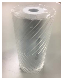
溝付きローラーの透明模型