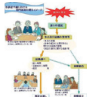
図-3 専門委員の仕事