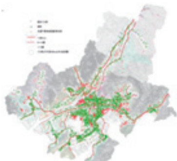
図-1 防府市生活交通マップ