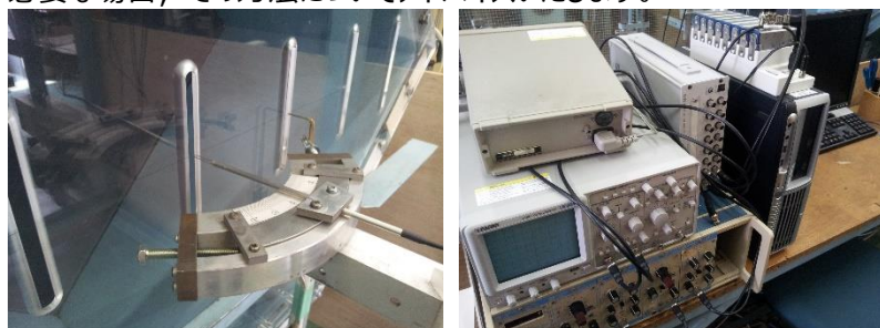
熱線流速計による計測システム