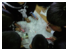
写真-2 ハザードマップの演習