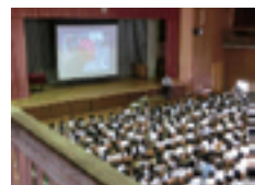
写真-4 交通安全講話のようす