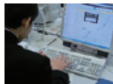
写真-3 GPSによる防災マップ作成