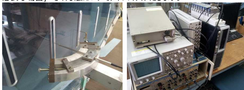
熱線流速計による計測システム