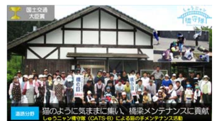
図-2 しゅうニャン橋守隊