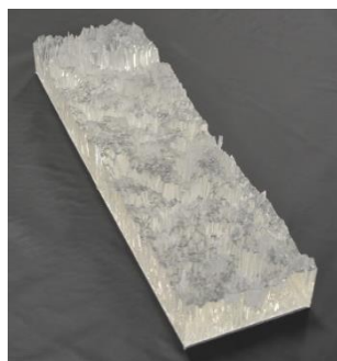
研磨パッド表面の透明模型

3Dプリンタやマシニングセンタで鋳型を作り，透明シリコンゴム製の模型を作製します。 研究室では，半導体ウェーハ研磨で使用する研磨パッドの表面を拡大した透明模型や，ローラーの透明模型を製作しています。透明シリコンゴムと屈折率を等しくした砂糖水の中に透明模型を入れると，光が屈折せずに透過するため，模型が見えにくくなったり，模型越しの背景がゆがまずに見えたりします。この特徴を利用して，物体内部の液体の流れを観察しています。