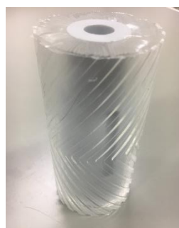
溝付きローラーの透明模型