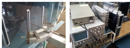
熱線流速計による計測システム