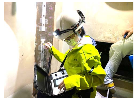
写真-2 磁歪応力測定