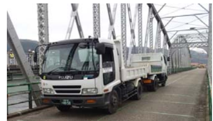
写真-1 実橋載荷試験