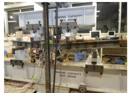
写真-1 腐食した H 形鋼の曲げ実験